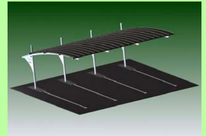
Módulos solares de capa fina para mayor integración en la cubierta.

En la mayoría de aplicaciones no es necesario un estudio previo de integración con el entorno como en centros comerciales o grandes superficies. No es así en lugares de gran interés paisajístico como pueden ser centros de negocios, zonas verdes, campos de golf, etc. Mediante este estudio de integración del entorno puede elegirse varios objetivos de la cubierta. Mimetismo con el entorno, participación en el paisaje o de concienciación medio ambiental. Para ello también se puede contar con paneles fotovoltaicos de integración arquitectónica como los módulos de placa fina o laminas tipo "thin film".