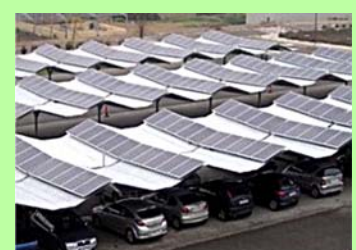
Disposición a 2 aguas